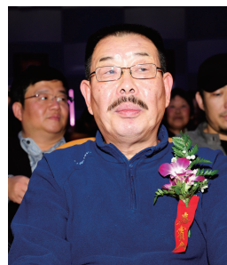
宋小明 中国音乐文学学会常务副主席