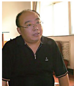
孟卫东 中国铁路文工团副总团长