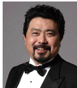
魏松 上海歌剧院院长、中国著名男高音歌唱家