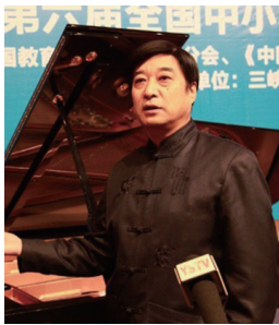
吴斌 中国教育学会音乐教育分会理事长