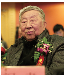
阎肃 中国音乐文学学会荣誉主席