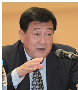
晓光 中国文联副主席