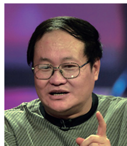
车行 空政文工团创作室主任