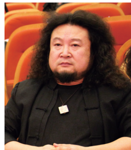
孟文豪 著名音乐制作人