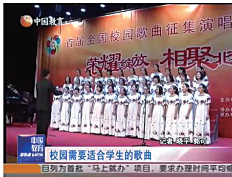
中国教育电视台报道