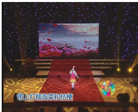
2014年1月19日22时30分,深圳电视台娱乐生活频道播出了第二届活动颁奖盛典