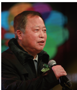
宋成栋 中国教育电视协会会长