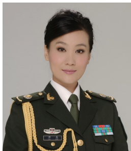
谭晶 总政歌舞团独唱演员