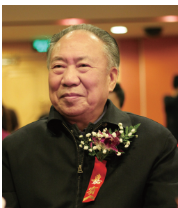
柳斌 原国家教育委员会副主任