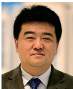
韩新安 中国音乐家协会秘书长