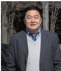
于禾 中国教育电视协会副会长