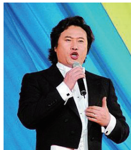
戴玉强 北京大学歌剧研究院客座研究员、总政歌剧团男高音歌唱家