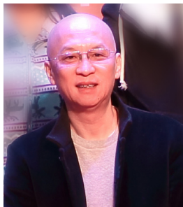
董乐弦 深圳市交响乐团首席作曲家